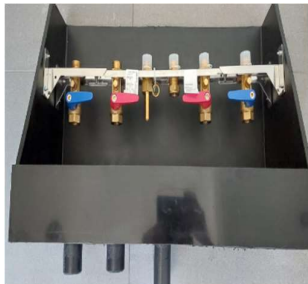
Prototype Tygo-box (OuiOui, 2024)